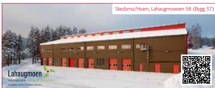
Skedsmo/Hvam, Lahaugmoveien 58 (Bygg 37)