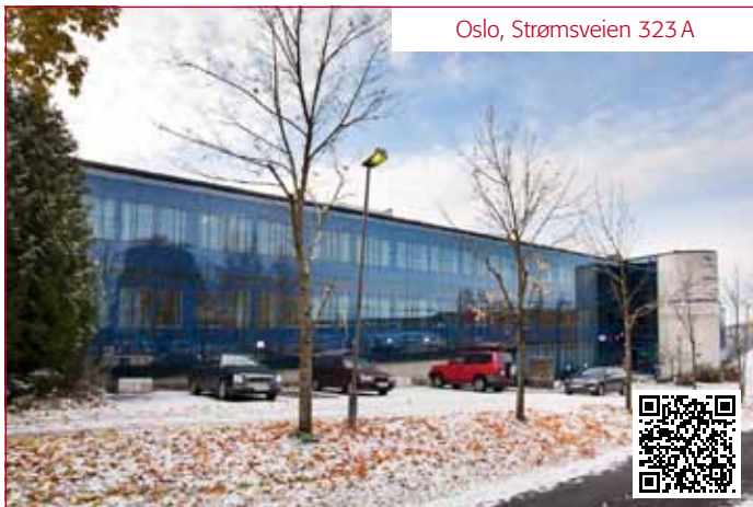
Oslo, Strømsveien 323 A