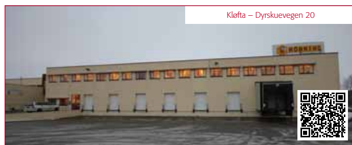
Kløfta – Dyrskuevegen 20