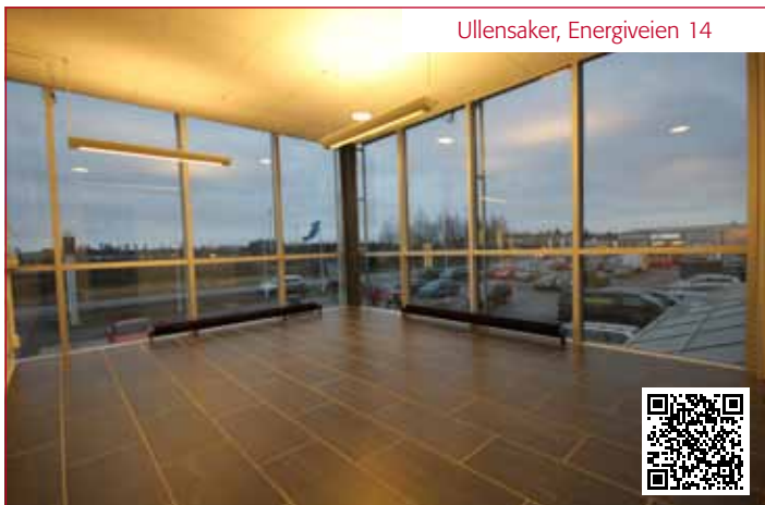
Ullensaker, Energiveien 14