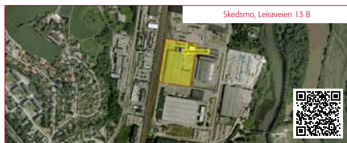
Skedsmo, Leiraveien 13 B