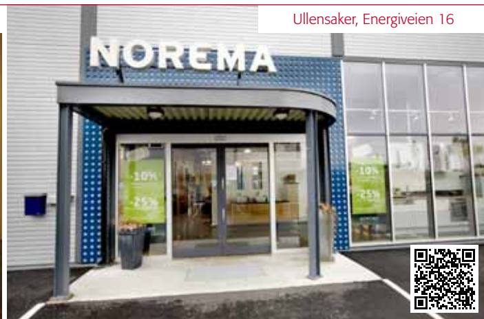
Ullensaker, Energiveien 16